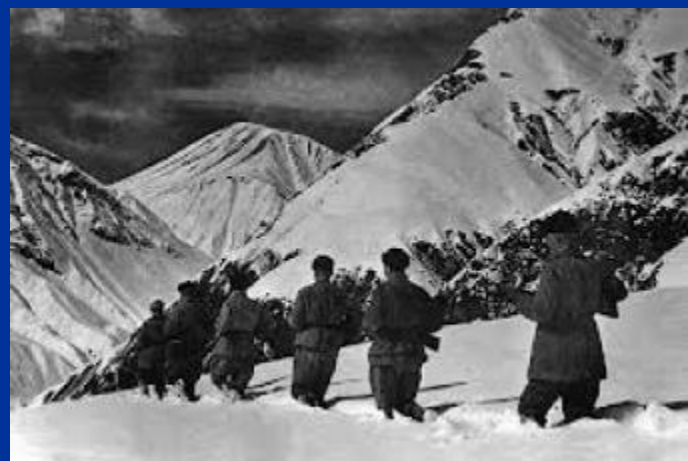
Битва за Кавказ

12 июля 1943 произошло крупнейшее в ходе Второй Мировой войны танковое сражение - что в нем участвовало более полутора тысяч танков. Сражение проходило возле российской деревни Прохоровка на Белгородском направлении - так называемая Курская дуга .