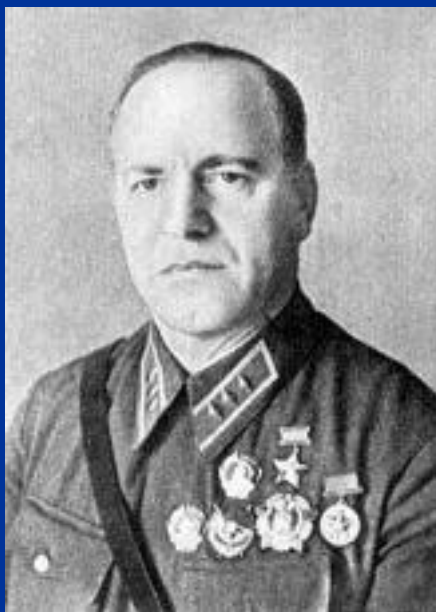
Г. К. Жукову