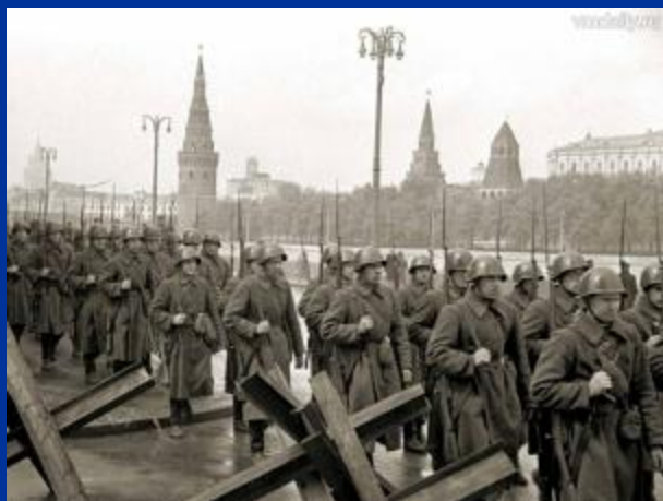
Битва за Москву